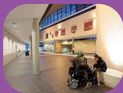
L'EREA Toulouse Lautrec

• Possibilité de convention pour les sportifs de Haut-Niveau pour mettre en place un projet réussite scolaire/réussite sportive